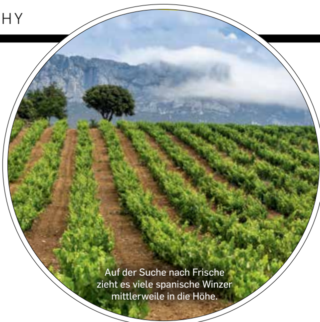
Auf der Suche nach Frische zieht es viele spanische Winzer mittlerweile in die Höhe.

Kirschkern, Marzipan, aber auch Veilchen.